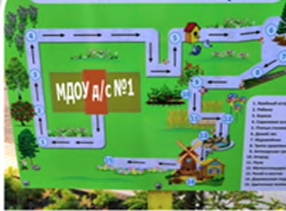
Схема экологической тропы